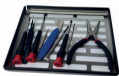
Support pour petits objets